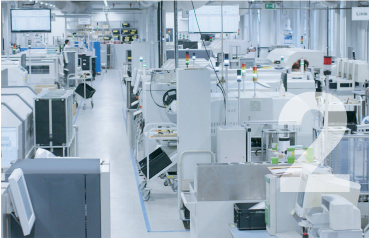
Das Bestücken von Leiterkarten ist die Kernkompetenz der TECTRON WORBIS GmbH.

hat die TECTRON WORBIS GmbH im technologischen Bereich einen großen Schritt nach vorn gemacht: Wir wenden inzwischen sämtliche Bestückungstechnologien an, vom manuellen Lötverfahren bis hin zum vollautomatischen Lötverfahren. Neben der Löttechnik bieten wir auch weitere Fertigungsprozesse an, wie beispielsweise die automatische Lackierung oder das Vergießen für den Explosionsschutz, also das hermetische Abdichten von Leiterkarten, damit kein Funkenflug stattfinden kann. Extrem Fahrt aufgenommen hat auch das sogenannte Box-Built, also die Montage von Leiterkarten und weiteren Baugruppentteilen bis hin zum vollständigen Produkt. Auch in logistischer Hinsicht haben wir uns zukunftsorientiert aufgestellt, zum Beispiel mit automatischen Hochregallagern, deren Wareneingangs- mit unserem Warenwirtschaftssystem (SAP) verbunden ist. Dies gewährleistet eine sichere Qualitätskontrolle der eingehenden Waren sowie eine lückenlose Rückverfolgbarkeit (Traceability) aller verbauten