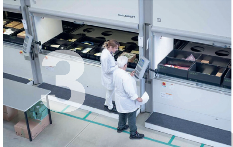
Automatische Hochregallager garantieren die Einhaltung höchster Qualitätsstandards